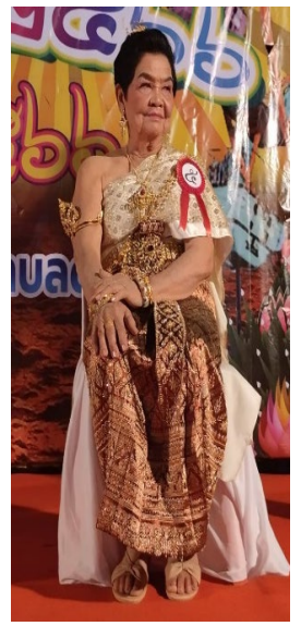
การประกวดนางนพมาศผู้สูงอายุ