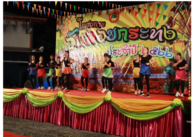
การแสดงของกลุ่มรักสุขภาพ