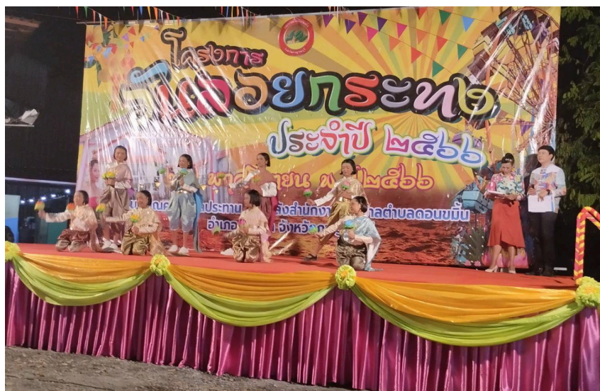
การแสดงของนักเรียนโรงเรียนวัดดอนขมิ้น ชื่อการแสดงรำโคลอมลอยประยุกต์