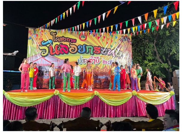
การแสดงศิลปวัฒนธรรมของชมรมผู้สูงอายุเทศบาลตำบลดอนขมิ้น