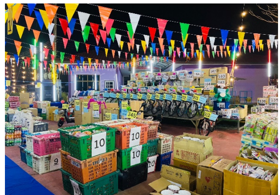
บรรยากาศ การจับรางวัลสอยดาวการกุศล