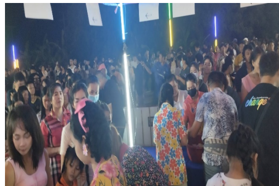
บรรยากาศ การจับรางวัลสอยดาวการกุศล