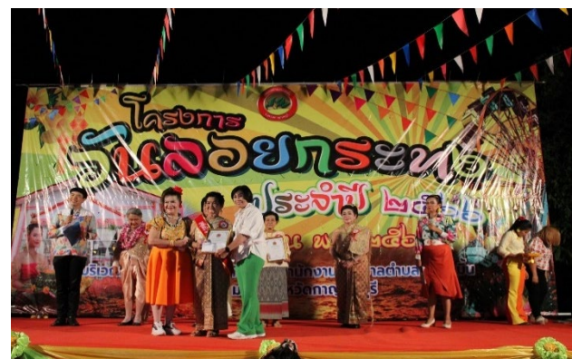
การประกวดนางนพมาศผู้สูงอายุ