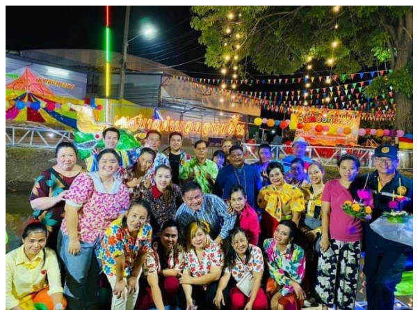
ประชาชนลอยกระทง บริเวณท่าน้ำที่เทศบาลตำบลดอนขมิ้นจัดเตรียมไว้ให้